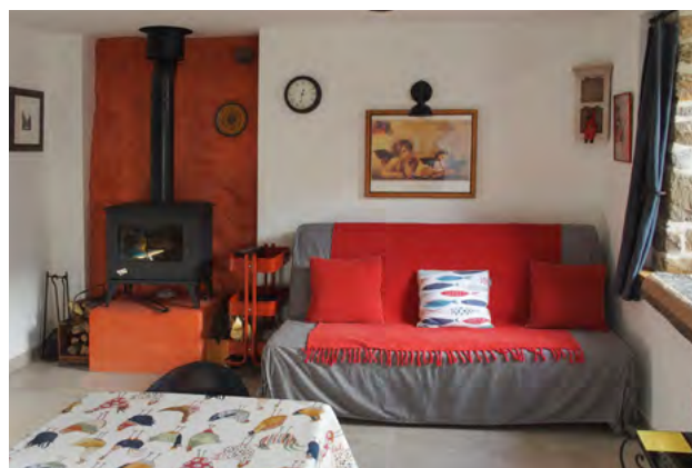
Coin couchage pour 2 personnes gîte au rdc 40 € par nuit

Pour réserver contacter Bénédicte : 06 63 56 80 73